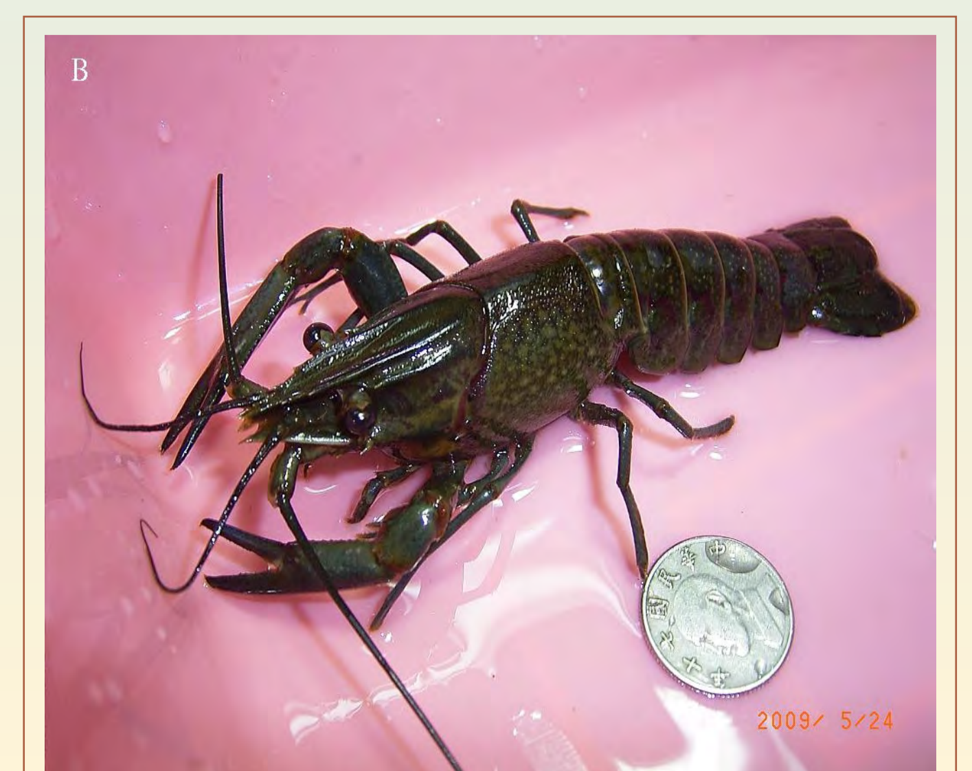
澳洲螯蝦 ▶ ( Cherax quadricarinatus )